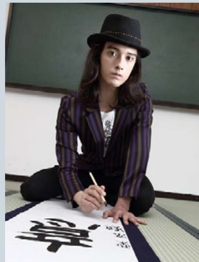
PROFILE 1994年12月6日生まれ。ファッションモデルとしてデビュー。2014年には「ヨウジヤマモト」のショーモデルとしてパリコレクションのランウェイデビューを果たし、以降3度にわたって出演している。モデルとしてだけでなく、バラエティ番組や、映画「黒執事」「僕は友達が少ない」、舞台「GO WEST」「気づかいルーシー」など、俳優としても活躍中。